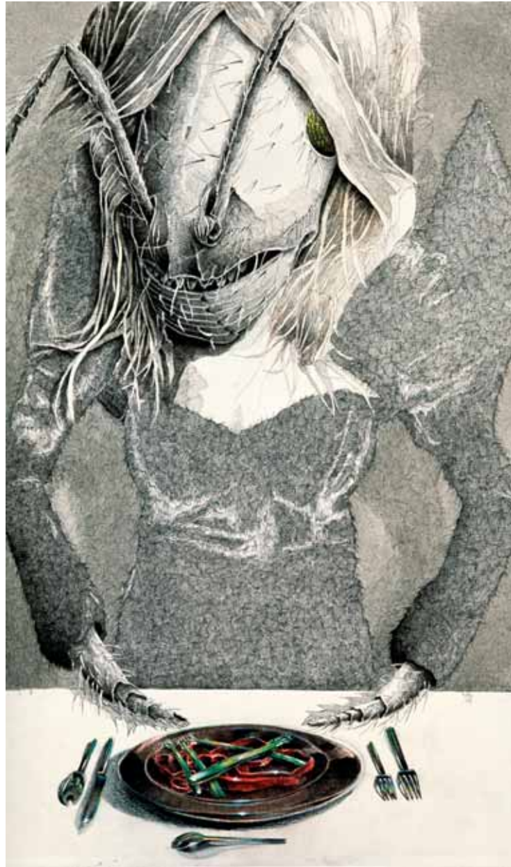
Oben: „DINNER“, 1000 x 600 mm, Tusche und Farbstift